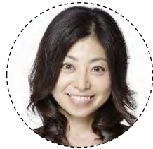
「ONE PIECE」 (ナミ)