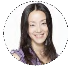
「攻殻機動隊」シリーズ (草薙素子)