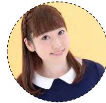
「アイドルマスター シンデレラガールズ」 (双葉杏)