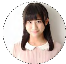
「ユリシーズ ジャンヌ・ダルクと 錬金の騎士」 (ジャンヌ・ダルク)

※ 内容をよくご確認の上ご応募ください。 ※ 記載されている内容は予定ですので変更する可能性があります。