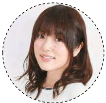
「selector シリーズ」 (小湊う子)