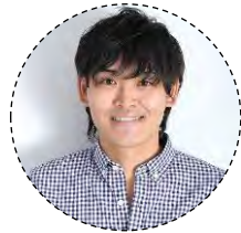
「BORUTO-ボルト- NARUTO NEXT GENERATIONS」 (ミツキ)