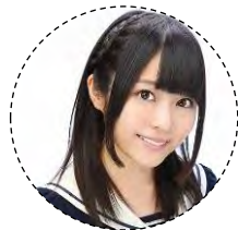
「ありふれた職業で世界最強」 (ユエ)