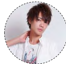
「マーベル スパイダーマン」 (スパイダーマン)