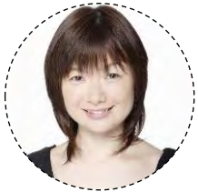
「ポケットモンスター」シリーズ (ピカチュウ)